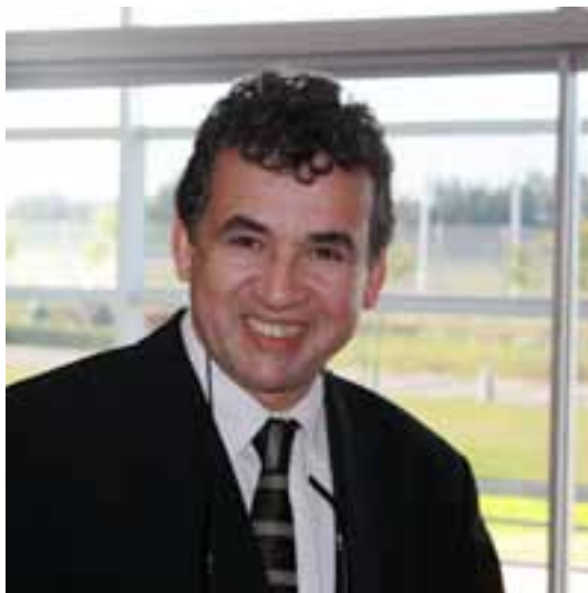
M. Nouredine MOUADDIB Président de l'Université Internationale de Rabat