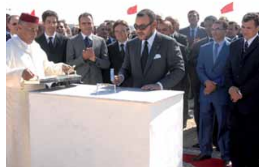
Pose de la première pierre par Sa Majesté le Roi Mohammed VI le 14 septembre 2010.